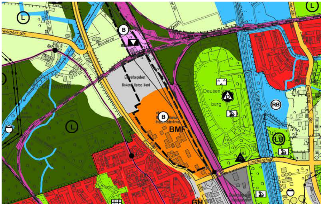
Abbildung 3: Regionalplan Ruhr I. Entwurf

Der seit dem 31.12.2004 rechtswirksame Flächennutzungsplan der Stadt Dortmund stellt den Planbereich des aufzustellenden Bebauungsplanes Hu 127 - östlich Emscherallee - größtenteils als Gewerbegebiet dar. Nördlich der Güterumgebungsbahn ist eine Grünfläche dargestellt. Südlich der Güterumgebungsbahn ist ein Gewerbegebiet dargestellt. Auf dem ehemaligen Werksgelände sind die Flächen im Jahre 2019 aus der Bergaufsicht entlassen worden und stellen sich als Gewerbegebiet dar.